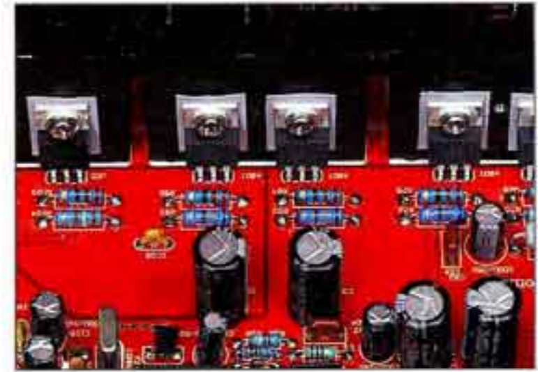
Heizer: Ordentliche Kühlkörper für die Spannungsregler sind unabdingbar

Noch ein Wort zur Ausstattung. Der CD1 hat einen Digitalausgang. Das verstehe ich nicht. Diese Ausgangsstufe zu umgehen, stellt schwerstes hifide-