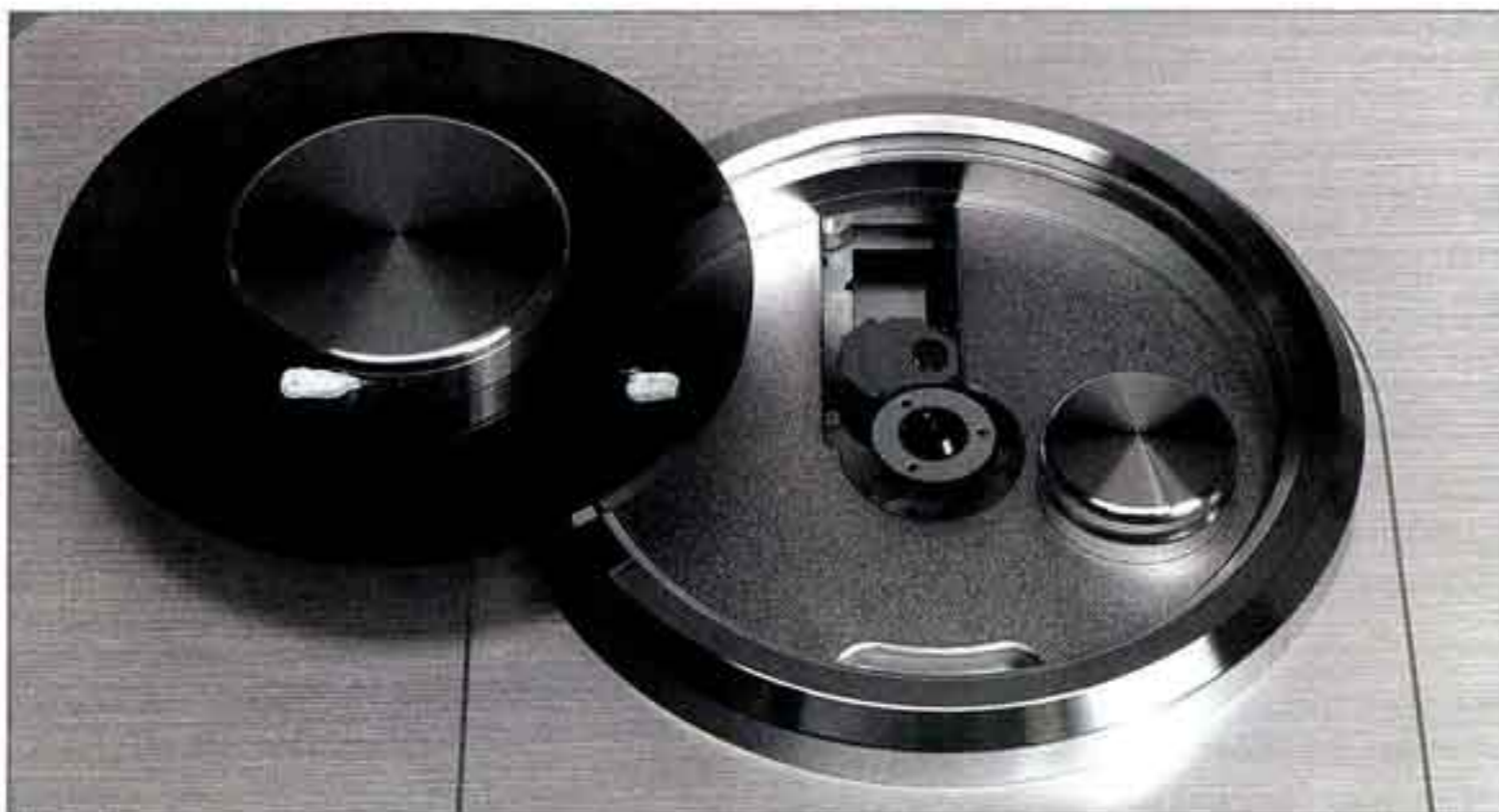
Bei Ayon bevorzugt man das Toplader-Prinzip, da es sich vibrationsseitig gut kontrollieren lässt. Ob es wohl mit oder ohne Acryldeckel besser klingt ...?

Bleiben wir klassisch. Mit der Besetzung Cymbal, Akkordeon und Violine (der Kontrabass sei jetzt mal außen vor) ist Gilles Apaps Aneignung von Vivaldis Vier Jahreszeiten (Apapaziz Productions GkJ 00102) ein leicht obertonlastiges Klangspektakel. Das geht mit einem uneingespielten CD1 durchaus auf die Plomben. Wie ändert sich aber das Bild, wenn der Österreicher warm und weichgeklopft den Pits auf den Grund geht! Die Töne nehmen Beziehung zueinander auf, das Geschehen auf der virtuellen Bühne erhält Plastizität, das Relief, schon anfangs alles andere als platt, weitet sich