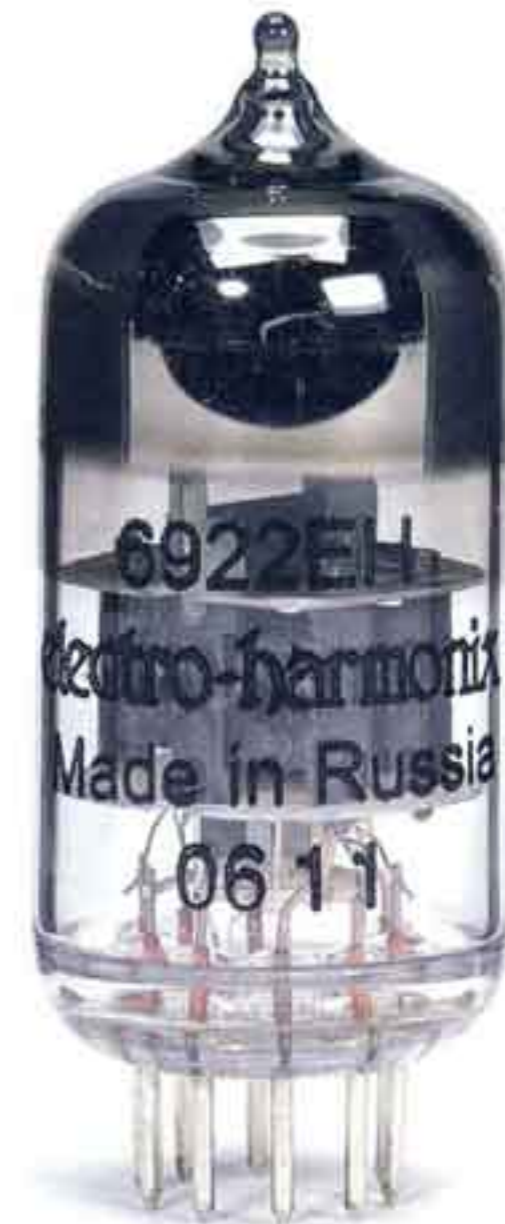
Zwei 6922-Doppeltrioden kooperieren mit den edlen 6H30-Glaskolben

Die Mechanik stammt von Sony und wird samt zugehöriger Steuerelektronik unmodifiziert verbaut. Nimmt man den sauber gefertigten, ansonsten eher unspektakulären Acryldeckel ab, hat man den CD-Antrieb in seiner ganzen Pracht vor sich. Die Silber-