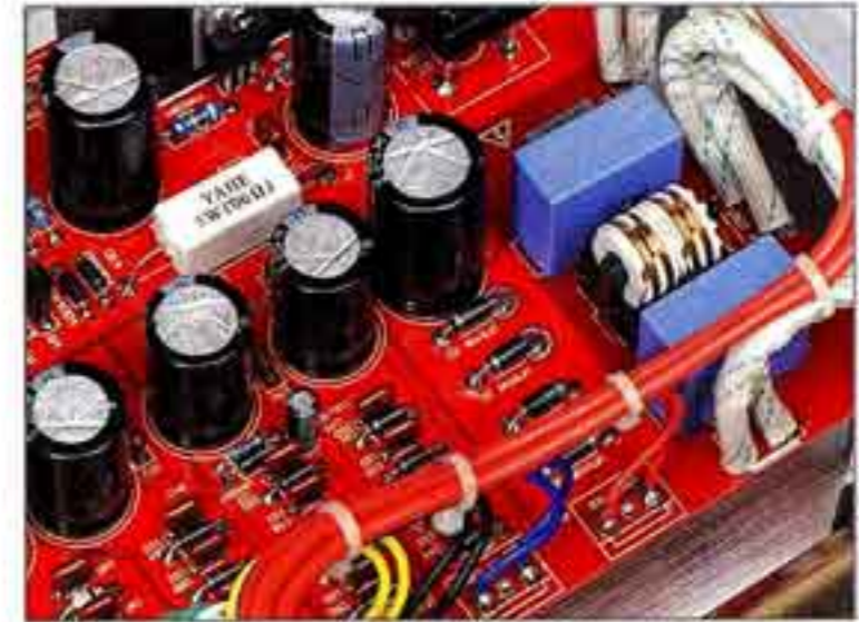
Sauberer Strom: Ein CLC-Glied dient als Netzfilter vor dem Trafo