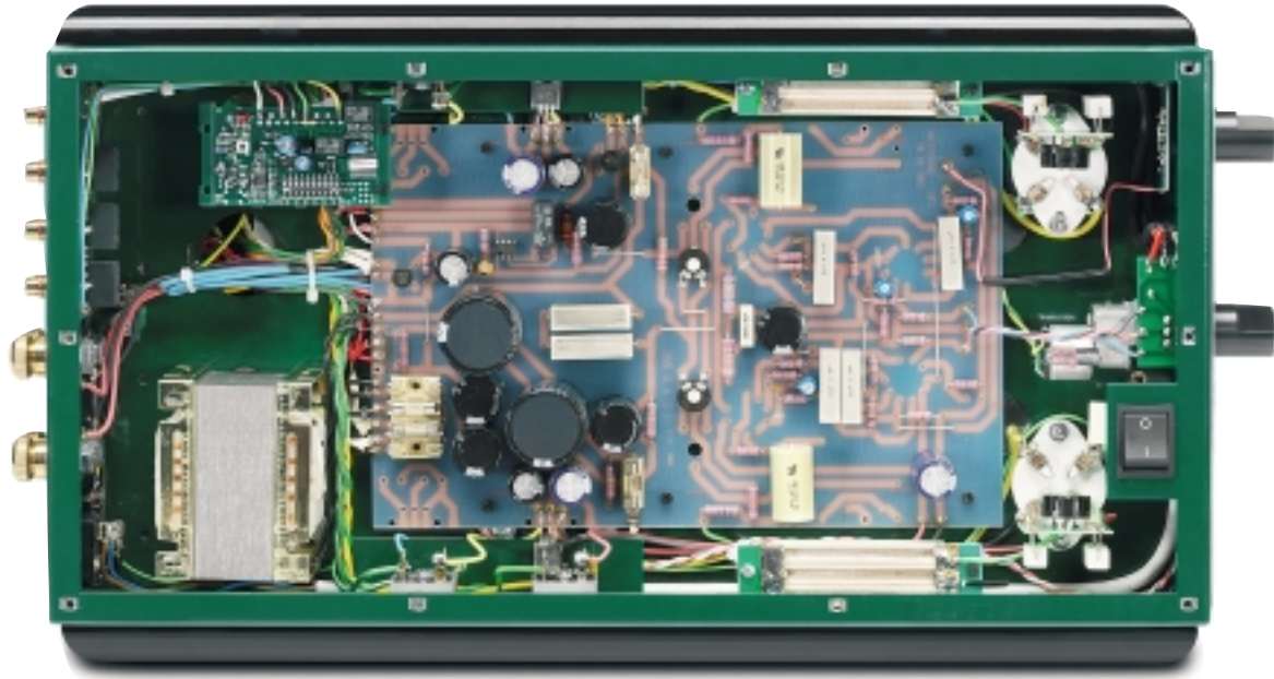
Ganz links unten die Siebspule für die Anodenspannung, ganz rechts im Bild die beiden Fassungen der Endröhren

ten, lässt sich diese 300B ganz einfach auch auf „echte“ 300Bs mit anderen Betriebsspannungen umstellen, wodurch letztlich sogar datentechnisch alle der alten Original-300B entsprechenden Röhren zum Einsatz kommen können. Verbunden mit Leistungsverlust, versteht sich, denn trotz seiner Bezeichnung hat der Ayon-Power-Brenner mit einer alten 300B natürlich nichts gemeinsam außer der Tatsache, dass er ebenfalls eine Triode darstellt.